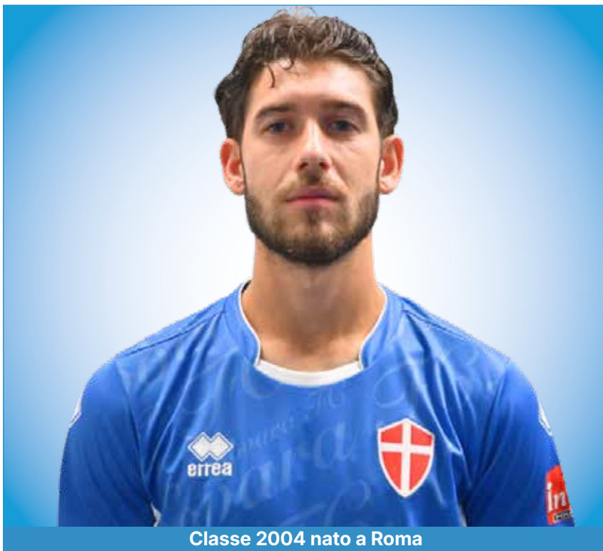
Classe 2004 nato a Roma