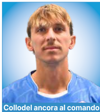
Collodel ancora al comando