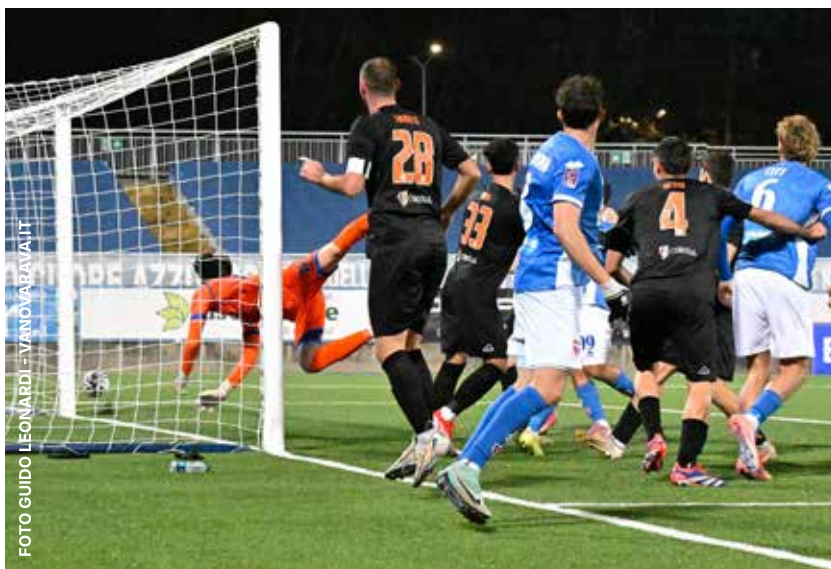
Partita di andata: un vano tentativo azzurro di segnare un gol