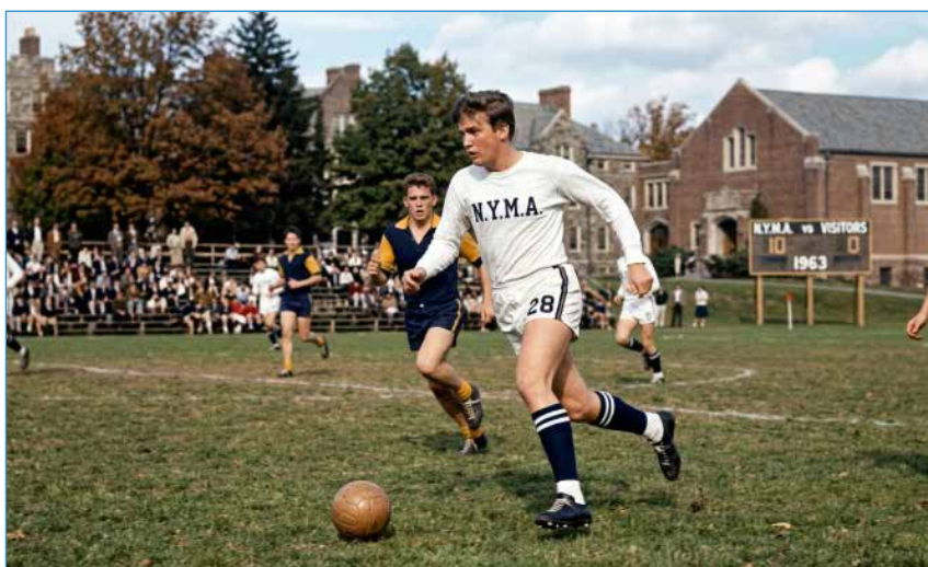
Una foto di Trump col pallone da calcio: foto vera o suggestione AI?

lometri quadrati. Dopo il cessate il fuoco del gennaio 1992, sancito dal Piano Vance, le Nazioni Unite dispiegarono i caschi blu nelle cosiddette Zone Protette (UNPA), ma la situazione rimase congelata per tre anni. Fu in questo limbo tra guerra e non-pace che nacque un campionato di calcio. A Srb, un piccolo centro della Lika che già nel nome porta il peso di un'identità contesa, si disputò la prima partita ufficiale: una selezione della Banija e del Kordun contro i rappresentanti di Slavonia, Lika e Dalmazia. Venne fondata la Federazione Calcistica della RSK, il territorio fu diviso in cinque regioni e i club cominciarono a organizzarsi. Nella sola zona della Banija e del Kordun ne sorsero dodici. Al picco della sua breve vita, nella stagione 1993/94, la lega arrivò a coinvolgere circa 59 squadre nel campionato e oltre cento iscritte alla coppa nazionale!