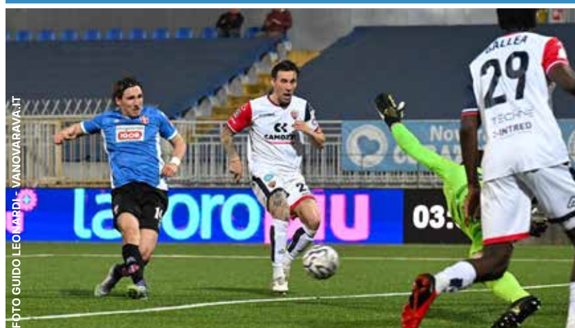
Tutta la delusione di Da Graca per un'occasione sprecata