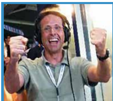
di Paolo Molina

Troppo importante lasciarsi nel modo giusto