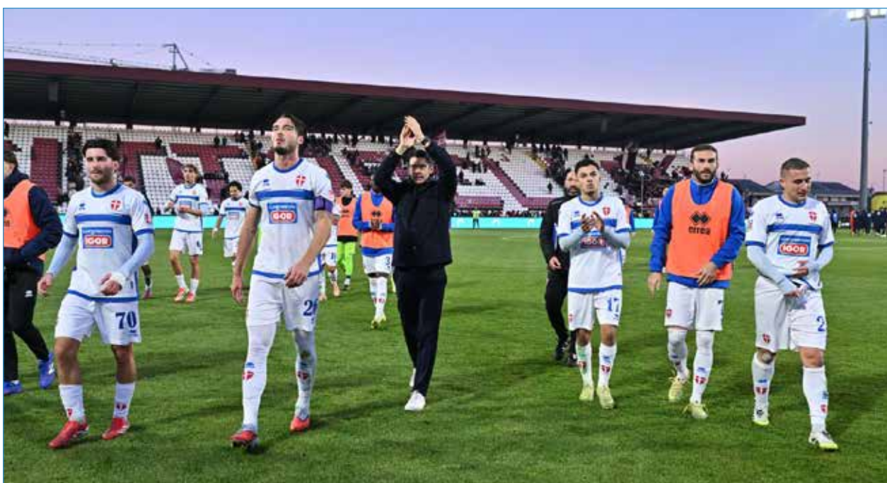
I giocatori azzurri salutano i tifosi al termine della partita

A questo punto ho terminato di scrivere (al 99x100 come sappiamo) il 19esimo articolo per il Nostro Amato Fedelissimo per il campionato in corso. Così va la vita, Direttore. E come sempre: FOOOORZA NO-OOVARAAAA