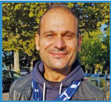
di Fabrizio Gigo

Il giovane difensore di scuola romanista crede ancora alla rincorsa playoff