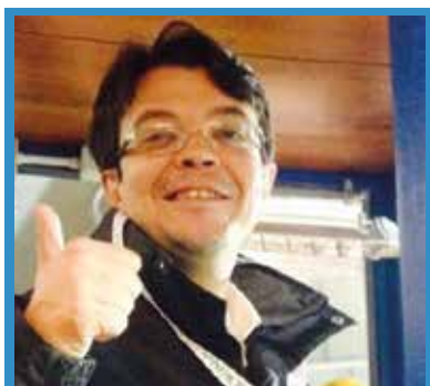
di Massimo Barbero

Speranze play off ridotte al minimo per un Novara dal rendimento inferiore alla passata stagione